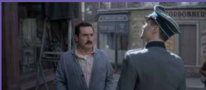
ADIEU MONSIEUR HAFFMANN