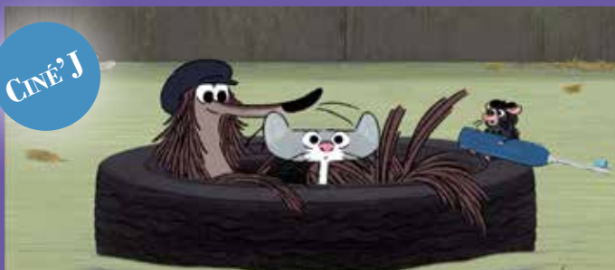
CHIEN POURRI, LA VIE À PARIS